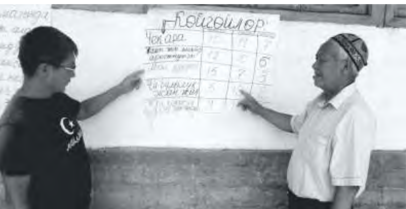
Процесс приоритизации проблем в Ала-Буке