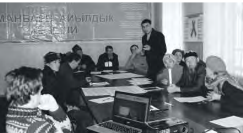
Члены рабочей группы в Аманбаево разрабатывают совместный план