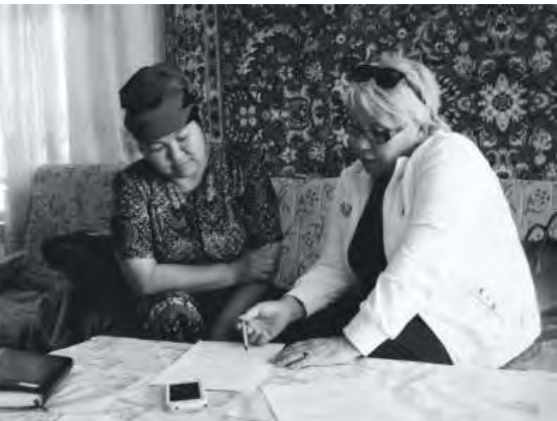
Анкетирование с представителями населения Жети-Огуза для выявления проблем