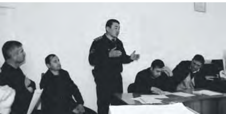
Разработка совместного плана в Уч-Коргоне