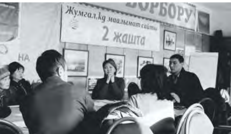
Разработка совместного плана в Чаеке